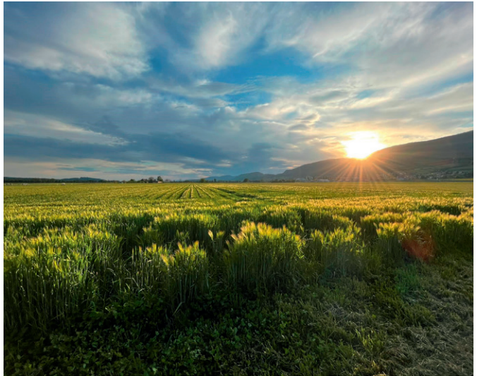
Ökoelement «Hasengasse» im Gerstenfeld, zur Förderung der Feldhasen und Feldlerche.

So können heute neben Wiesen für Tiere auch Ackerkulturen angebaut werden. Heute findet man unter anderem Zuckerrüben, Raps, Sonnenblumen, Soja, Mais und die verschiedensten Futter- und Brotgetreide. Da der grösste Teil der Witiböden einen hohen Tongehalt aufweist, eignen sich die meisten Böden aber kaum für den Anbau von Kartoffeln und Gemüse.