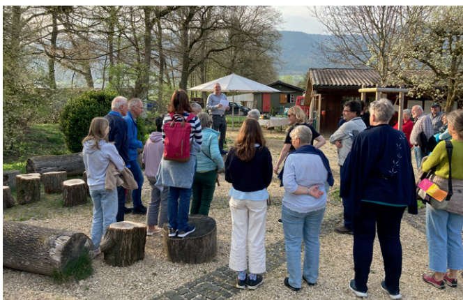
Die offizielle Eröffnungsfeier im April ist jeweils das erste Highlight in der Saison des Infozentrums Witi.

Das Infozentrum Witi Altreu öffnete in der Saison 2022 seine Tore zum ersten Mal bereits Mitte März. Die um einen Monat frühere Öffnung hat sich gelohnt. So zählten wir in diesem Jahr rund 35 000 Besuchende, 5000 mehr als in den besten Jahren zuvor. Die offizielle Eröffnung fand am 14. April statt, zu welcher u. a. auch die Altreuer Eigenheim Besitzer mit einem Storchenhorst auf ihrem Dach eingeladen wurden.