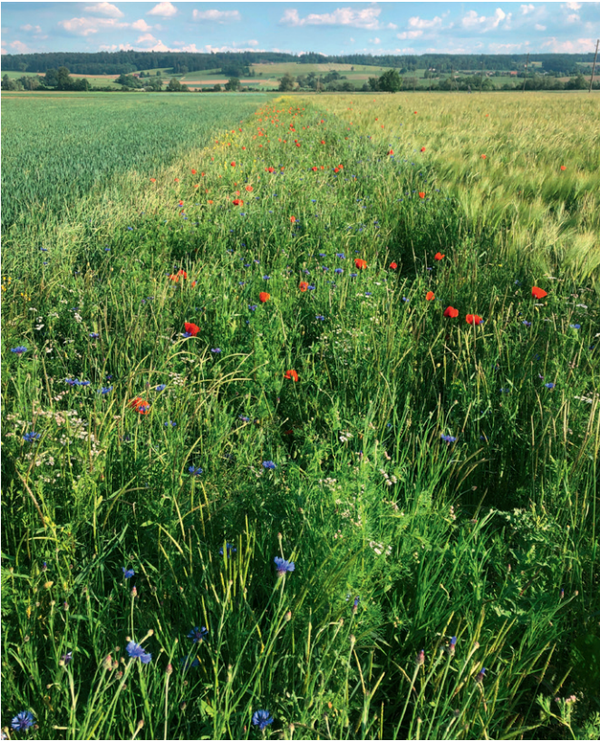
Artenreicher Blühstreifen zur Nützlingsförderung.

Die Drainagen der Landwirtschaft haben den Wasserhaushalt der Witi grundlegend verändert; das frühere Sumpfland wurde trockengelegt. Damit die charakteristischen Tiere und Pflanzen überleben können, braucht die Witi wieder Wasser, dosiert zur rechten Zeit und am rechten Ort. Die Kreuzkröte und der Laubfrosch brauchen Flächen, die im Frühling und Frühsommer überschwemmt sind und dann im Hochsommer bis Herbst trockenfallen. Diese Flächen müssen nach dem Abtrocknen gemäht werden, damit sie offenbleiben. Die rastenden Watvögel brauchen Äcker, welche zur Zugzeit überschwemmt sind. Solche Lebensräume waren früher zur Genüge vorhanden in der Witi. Heute sind sie Mangelware.