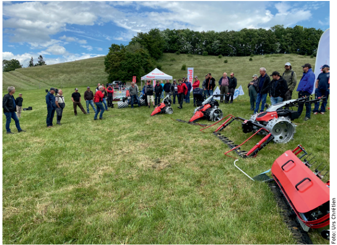
Das Interesse war gross an der Vorführung moderner Hangmäher in Laupersdorf.